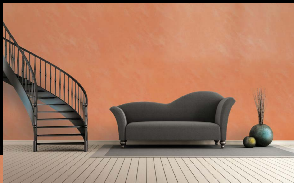
Antico grosso Lava Stufe 1 mit Antico Lava Stufe 3