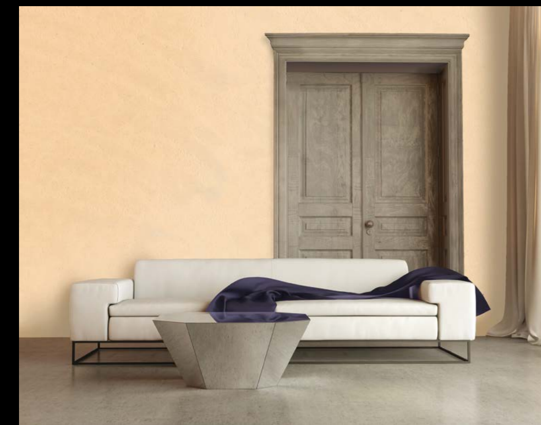
Antico grosso Maremma Stufe 3

Zwei bewährte Produkte - MARMARA Antico grosso und Antico in Kombination ergeben exklusive Oberflächen ähnlich der traditionellen Spachteltechnik.