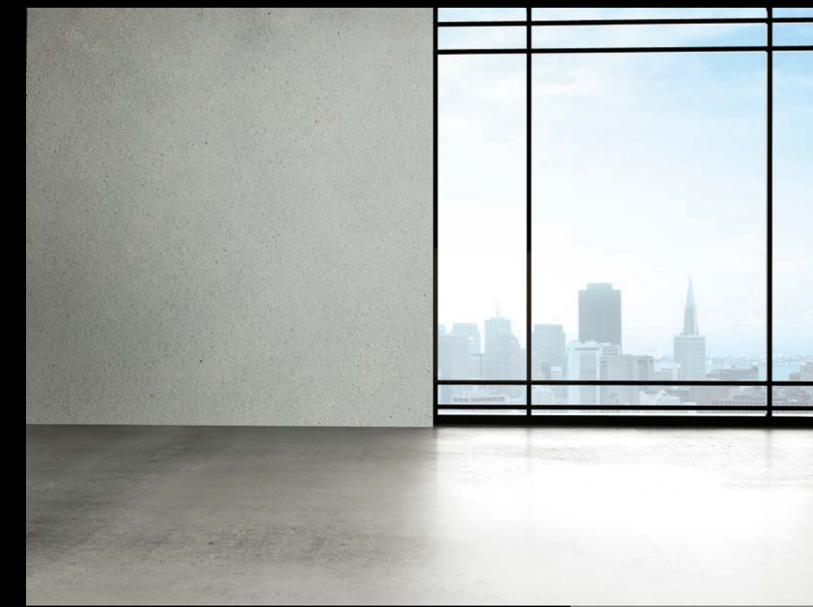
Antico grosso Granada Stufe 1