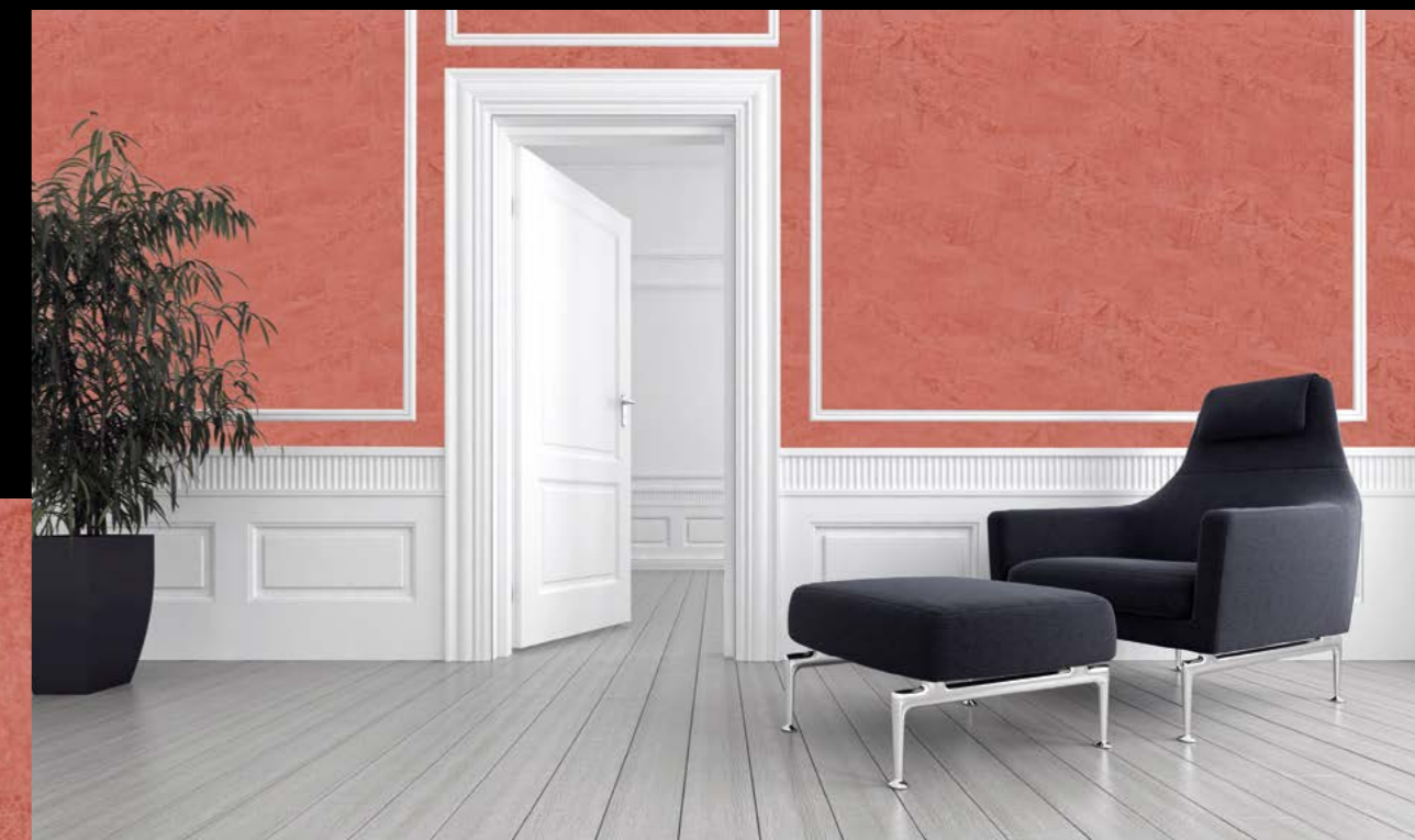
Antico grosso Flamengo Stufe 1 mit Antico Flamengo Stufe 3

Eventuelle Farbabweichungen gegenüber den Originalfarbmustern sind drucktechnisch bedingt und berechtigen später nicht mehr zu Beanstandungen.